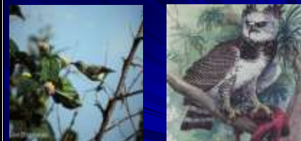
Птицы, обитающие в джунглях